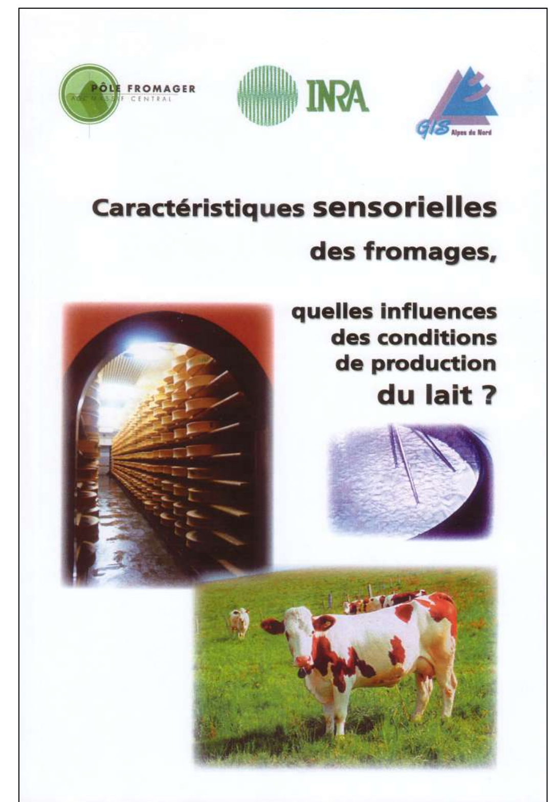
Ouvrage de synthèse publié en 2005